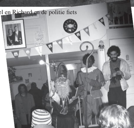
Sint en Piet in de inloop Oud-West